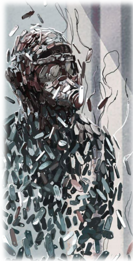
Concept tekeningen als impressie gemaakt door epoxygieten.nl